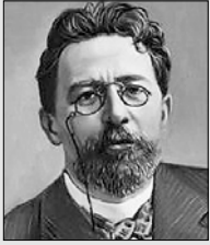
Антон ЧЕХОВ, русский писатель

“ Дети свя- ты и чисты. Нельзя де- лать их игрушкой своего настроения.