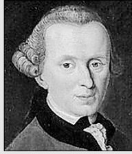
Иммануил КАНТ, немецкий философ

“ Дети свя- ты и чисты. Нельзя де- лать их игрушкой своего настроения.