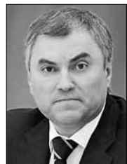
Вячеслав ВОЛОДИН, председатель Государственной Думы РФ

Патриарх призвал одуматься тех, кто, взяв в руки оружие, готов направить его против своих собратьев, и выступил за необходимость хранить народное единство нашей страны и молитвами поддерживать российских бойцов и друг друга.