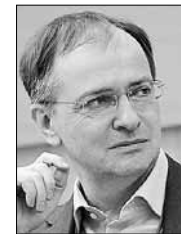
Владимир МЕДИНСКИЙ, помощник Президента России

Происходящее Кадыров назвал «ножом в спину»: «Не время для озвучивания личных обид и решения споров в нашем тылу. Представьте, что сейчас чувствуют ребята в окопах, перед лицом которых враг, а за спиной – предательская авантюра. Речь о стабильности, о сплоченности государства, о безопасности граждан».