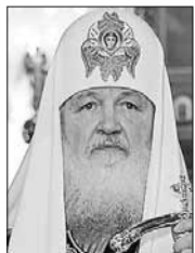
Кирилл, Патриарх Московский и всея Руси

Слова священнослужителя приводит пресс-служба РПЦ