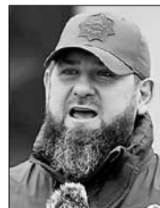
Рамзан КАДЫРОВ, глава Чечни

Спикер Совфеда отметила, что сила такой огромной и многонациональной страны, как Россия, заключается в единстве и исторической нетерпимости к предательству и провокаторству.