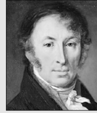
Николай КАРАЗИН, русский писатель, историк

“ Будь правдив даже по отно- шению к дитя- ти: исполний обеща- ние, иначе приучишь его ко лжи.