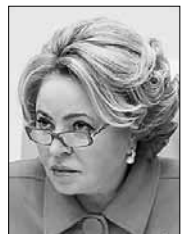
Валентина МАТВИЕНКО, председатель Совета Федерации

Вячеслав Володин подчеркнул, что нам противостоит общий внешний враг, который продвигает идеологию нацизма – уничтожает российских граждан, угрожает безопасности нашей страны. В этой ситуации необходимо еще больше сплотиться и сделать все для победы.